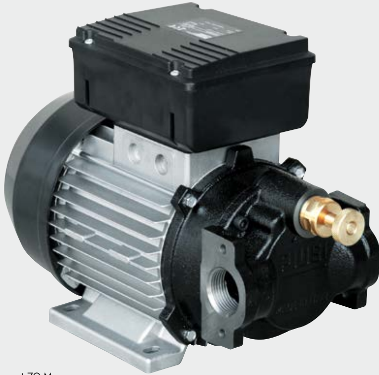
Viscomat 70 M